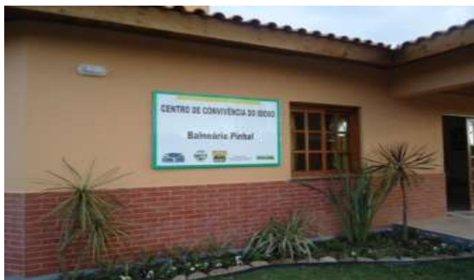
Balneário do Pinhal/RS

DESCRIÇÃO: Unidade pública, referenciada a um CRAS, destinada ao desenvolvimento do Serviço de Convivência e Fortalecimento de Vínculos de acordo com o perfil sócio-demográfico dos territórios e considerando o atendimento de situações prioritárias (em situação de isolamento; trabalho infantil; vivência de violência e/ou negligência; crianças e adolescentes fora da escola ou com defasagem escolar superior a 2 (dois) anos; em situação de acolhimento; em cumprimento de medida socioeducativa em meio aberto; egressos de medidas socioeducativas; situação de abuso e/ou exploração sexual; com medidas de proteção do Estatuto da Criança e do Adolescente - ECA; crianças e adolescentes em situação de rua; vulnerabilidade que diz respeito às pessoas com deficiência).