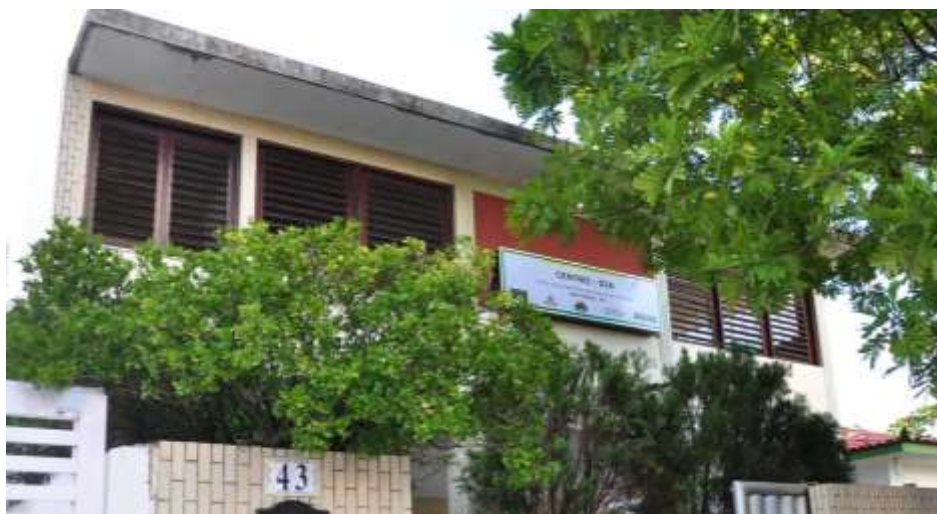
Município de João Pessoa/PB

DESCRIÇÃO: Equipamento da proteção social especial de média complexidade destinado à realização do serviço de Proteção Social Especial para Pessoas com Deficiência, Idosas e suas Famílias, cujos cuidados não possam ser dispensados no domicílio ou em outros serviços da rede. O serviço ofertado no Centro Dia deverá buscar a diminuição da exclusão social tanto do dependente quanto do cuidador, a sobrecarga decorrente da situação de dependência/prestação de cuidados prolongados, bem como a interrupção e superação das violações de direitos que fragilizam a autonomia e intensificam o grau de dependência da pessoa com deficiência ou pessoa idosa.