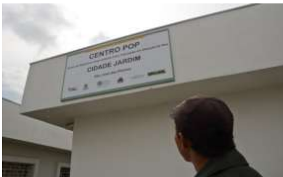
Município de São José dos Pinhais/PR

DESCRIÇÃO: Unidade pública estatal de referência destinada ao atendimento especializado à população de adultos e famílias em situação de rua, proporcionando convívio grupal e social para o alcance da autonomia e estimulando a organização, a mobilização e a participação social, por meio da oferta obrigatória nessas unidades do Serviço Especializado para Pessoas em Situação de Rua.